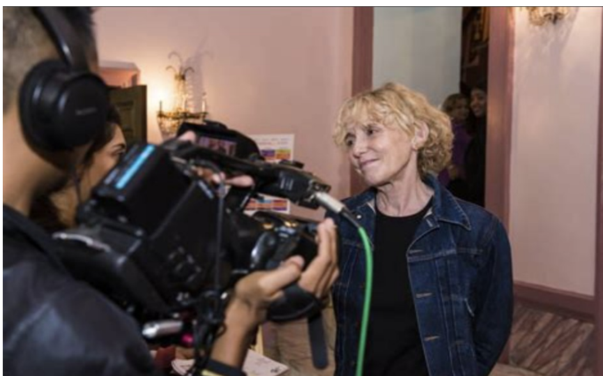
Claire Denis, réalisatrice

Cette année, lundi 31 mars 2025, suite à la projection de Beau Travail de Claire Denis, les élèves ont échangé avec une critique de cinéma qui travaille pour le magazine Sorociné ( https://www.sorocine.com ).