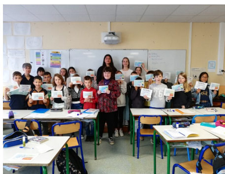
Ecole P.M. France