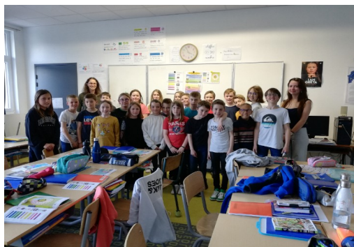
Ecole St Joseph