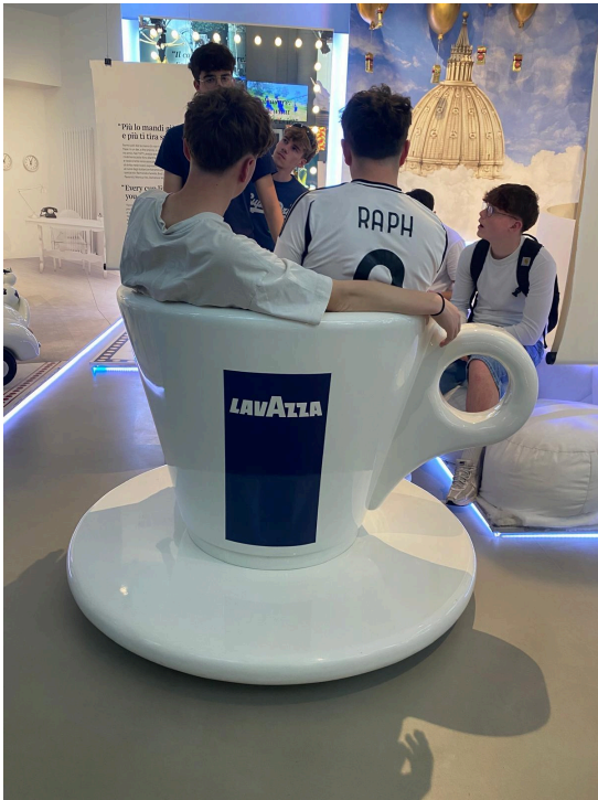
Le canapé tasse.