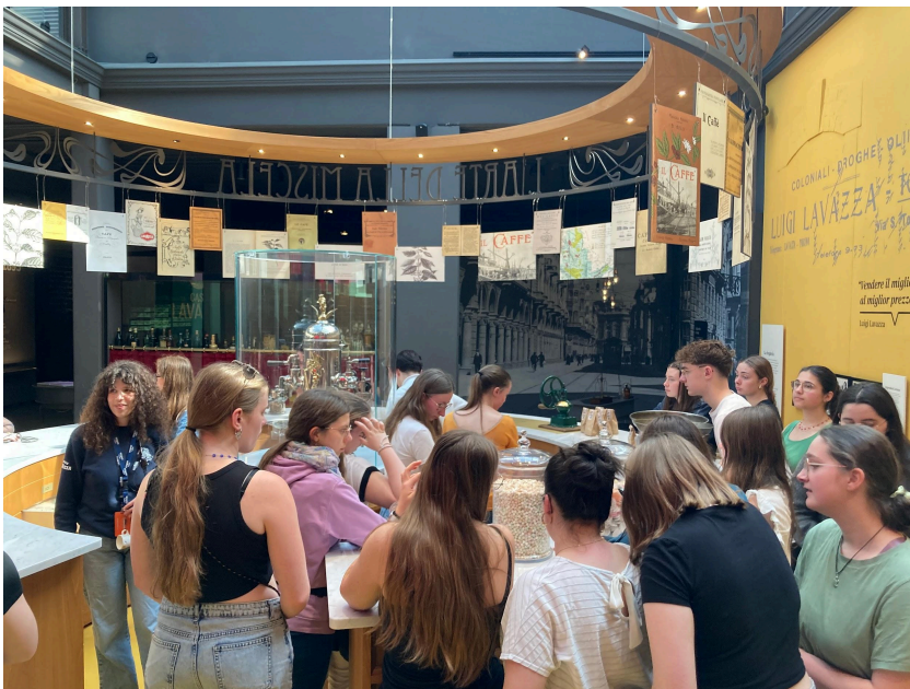
Visite du musée Lavazza