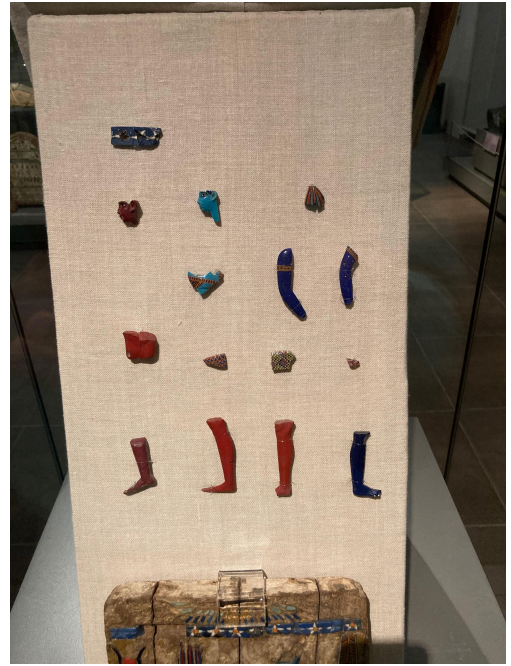
Encore de belles couleurs