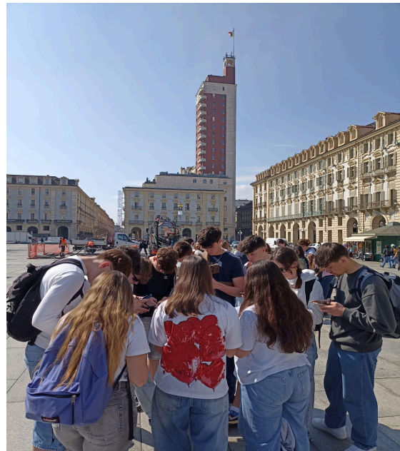
Une dernière présentation de la ville par les élèves