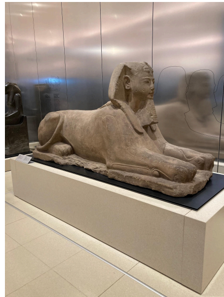
Un des sphinx du musée