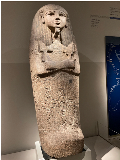
Un des emblématiques sarcophages du musée.

Ce soir, il est temps de faire les valises. Demain, nous passerons la journée à Milan.