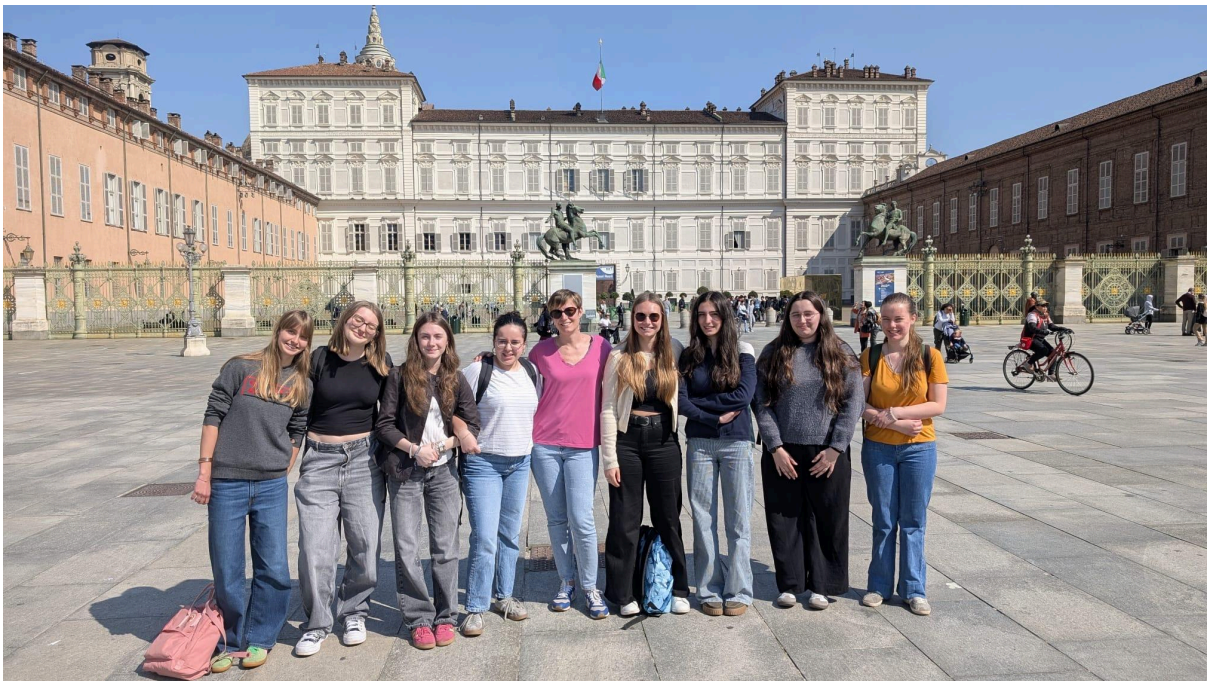
Les élèves de première