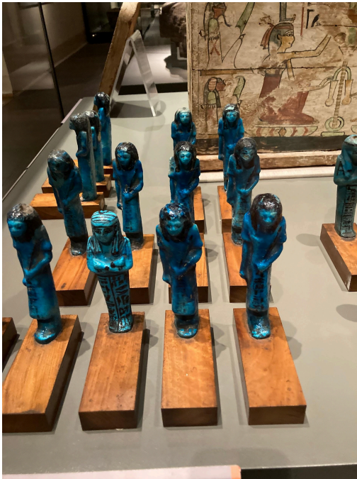
Une source d'inspiration pour James Cameron.