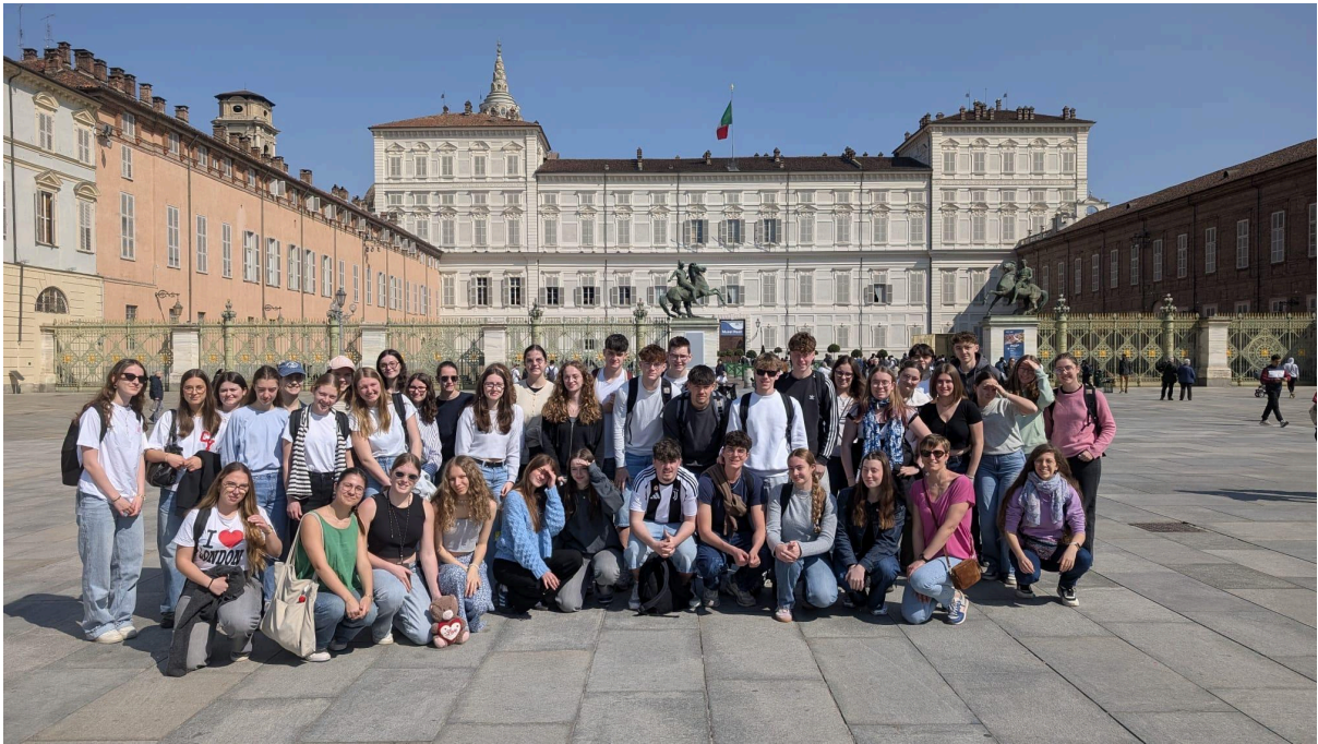
Les élèves de terminale