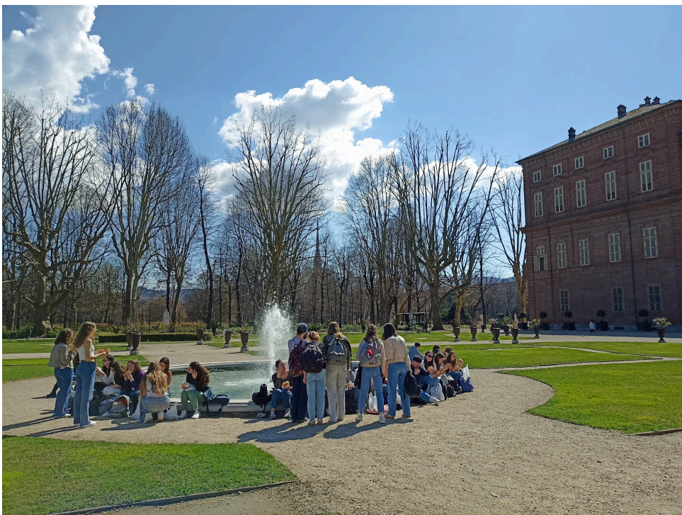
Pique nique dans les jardins royaux