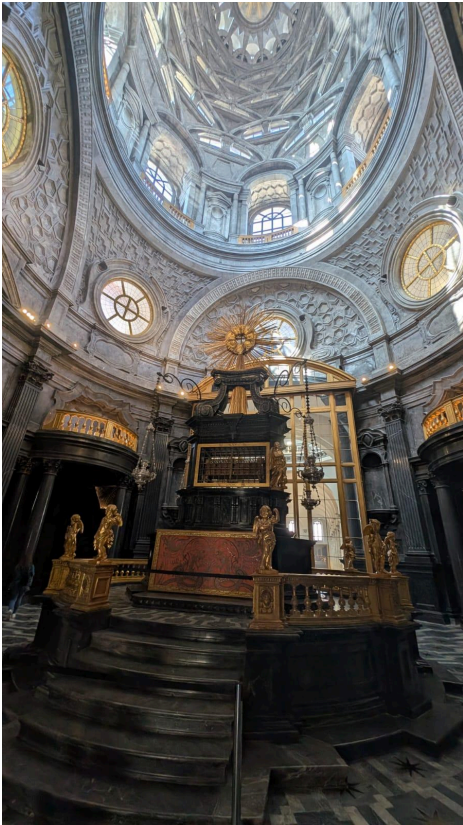
La cappella della Sindone