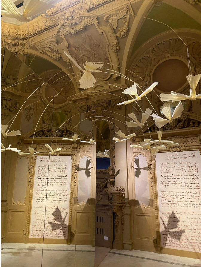
Oeuvre réalisée à partir du codex de Leonardo da Vinci