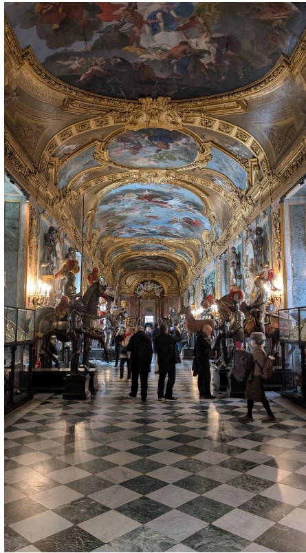
La salle des armes