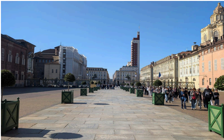
Vue sur un des restes du fascisme (« doigt de Mussolini »)