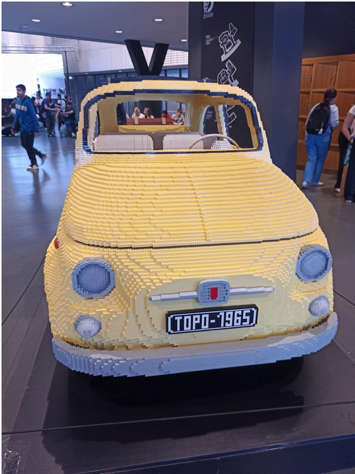
L'après-midi, visite du musée Fiat ; ici la Fiat en Legos