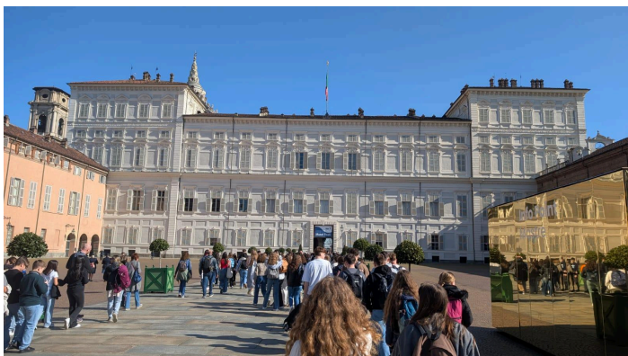
La façade du Palazzo Reale

Cette visite s'est conclue par un pique nique dans les jardins royaux. L'après-midi, nous avons visité le musée Fiat.