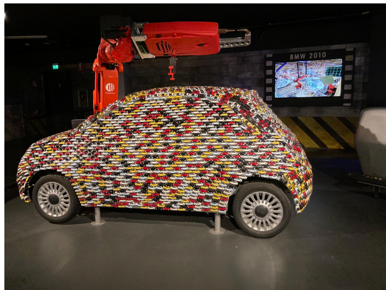
La voiture en voitures.